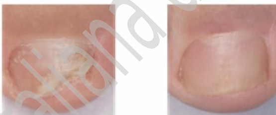
Prima del trattamento

E' importante proseguire il trattamento con lo smalto medicato fino alla completa risoluzione dell'infezione e alla completa rigenerazione dell'unghia. In genere occorrono circa 6 mesi di terapia per le unghie delle mani e da 9 a 12 mesi per le unghie dei piedi. Lei vedrà l'unghia sana ricrescere con il ridursi dell'unghia malata.