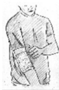
Fig. 6 Nel caso in cui TRANSACT Lat debba essere applicato su articolazioni molto mobili, come ad esempio il gomito od il ginocchio, è consigliabile l'uso del bendaggio di ritenzione accluso.

Applicare un solo cerotto medicato per volta sulla parte interessata ogni 12 ore.