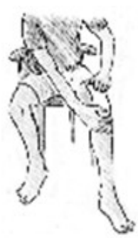
Fig. 5 Se la parte implicata è un'articolazione, prima dell'applicazione piegare leggermente l'articolazione stessa.

pellicola protettiva e applicare il lato adesivo direttamente sulla pelle.